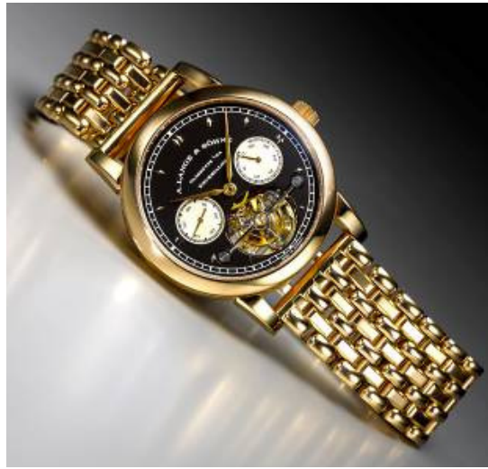
上图：朗格 (A. Lange & Söhne) 「Tourbillon 'Pour Le Mérite」限量玫瑰金芝麻炼陀飞轮链带腕表， 备动力储存显示 估价 100 万至 150 万港元 / 129,000 至 194,000 美元

香港，2010 年 3 月 香港蘇富比将于 2010 年 4 月 7 日假香港会议展览中心，举行名贵腕表春季拍卖会。本季隆重推出一系列卓尔不凡之私人珍藏，包括一个「重要私人珍藏」的多枚罕有之钛金属腕表，以及「华贵风尚私人珍藏」的多枚搜罗于 1970 至 1990 年代初之名贵时计。接近 330 件时计，总估价逾 3,500 万港元 / 448 万美元* ，其中多件拍品来源卓越，保存状态绝佳，必将带来激烈竞投。